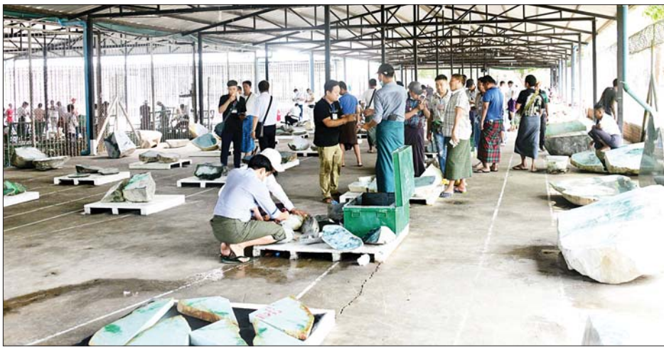
(၅၇)ကြိမ်မြောက် မြန်မာ့ကျောက်မျက်ရတနာပြပွဲတွင် ခင်းကျင်းပြသထားသည့် ကျောက်စိမ်းအတွဲ များကို ပြည်တွင်း ပြည်ပ ရတနာကုန်သည်များက လေ့လာကြည့်ရှုကြစဉ်။

နေပြည်တော် ဧပြီ ၂၆ (၅၇)ကြိမ်မြောက် မြန်မာ့ ကျောက်မျက်ရတနာပြပွဲ ပဉ္စမ နေ့ကို ယနေ့နံနက်ပိုင်းတွင် နေပြည်တော်ရှိ မဏိရတနာ ကျောက်စိမ်းခန်းမ၌ ဆက်လက် ကျင်းပရာ ပြည်တွင်း ပြည်ပ ရတနာကုန်သည်များဖြင့် စည်ကား လျက်ရှိသည်။ နံနက်ပိုင်းမှစတင်၍ ပြည်တွင်း ပြည်ပ ရတနာကုန်သည်များသည် မဏိရတနာ ကျောက်စိမ်းခန်းမ အတွင်း ခင်းကျင်းပြသထားသည့် ကျောက်စိမ်းအတွဲများနှင့် ခန်းမ အပြင်ဘက် သတ်မှတ်နေရာများ အလိုက် ခင်းကျင်းပြသထားသည့် ကျောက်စိမ်း အတွဲများကို စိတ်ကြိုက်လေ့လာ ကြည့်ရှုကြ သည်။ ယနေ့ပြပွဲတွင် ကျောက်စိမ်း အတွဲအမှတ်(၁) မှ (၇၀၀)အထိ အတွဲပေါင်း(၇၀၀)အတွက်ရတနာ ကုန်သည်များက တင်သွင်း ထားသည့် ဈေးနှုန်းတင်သွင်း လွှာများကို တာဝန်ရှိသူများက တင်ဒါ ဖွင့်ဖောက်စစ်ဆေးကာ ကျောက်စိမ်းအတွဲပေါင်း ၅၂၃