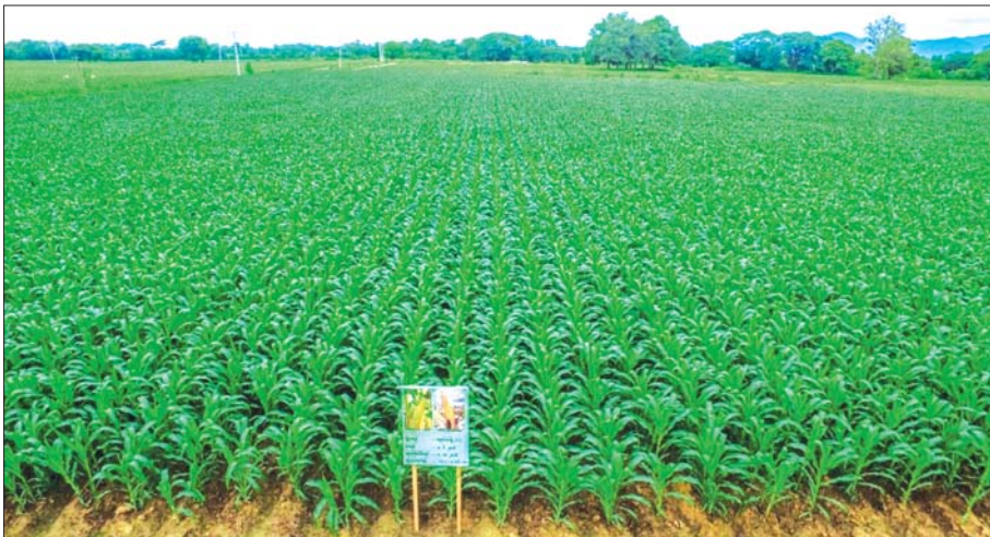
ပြောင်းစေ့မှ ပြောင်းဖူးဆီ၊ ပြောင်းဖူးပင်စည်မှ ဇီဝလောင်စာဆီ (Bio-ethanol) အထိ တိုးတက် ထုတ်လုပ်နေပြီ ဖြစ်သောကြောင့် စက်မှုထုတ်ကုန်များ မြန်မာနိုင်ငံတွင် တိုးတက်ထုတ်လုပ်လာနိုင်ပါက နိုင်ငံအတွင်း အစေ့ထုတ်ပြောင်း လိုအပ်ချက် မြင့်မားလာမည်ဖြစ်ရာ ပိုလျှံသည်များကိုလည်း

ကမ္ဘာပေါ်တွင် လူနှင့် တိရစ္ဆာန်များ စားသုံးရန် အတွက် နံစားသီးနှံအဖြစ် ဂျုံ၊ ဆန်စပါးနှင့် ပြောင်းဖူးကို အဓိကစိုက်ပျိုးထုတ်လုပ်ကြသည်။ မြန်မာနိုင်ငံအတွက် အဓိကလိုအပ်ချက်ဖြစ်သော တိရစ္ဆာန်စာလိုအပ်ချက် ဖြည့်တင်းရန်၊ ဆန်အစား ပြောင်းဖူးအဓိကထားသော ဒေသများသို့ ဖြည့်တင်းပေးရန်နှင့် ပိုလျှံသည်များကို ပြည်ပသို့တင်ပို့၍ နိုင်ငံခြားဝင်ငွေရရှိရန် စိုက်ပျိုးထုတ်လုပ်လျက် ရှိပါသည်။