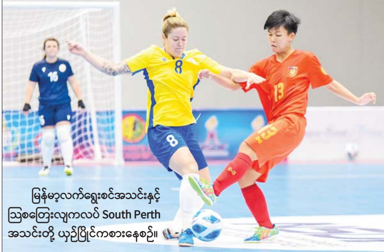
မြန်မာ့လက်ရွေးစင်အသင်းနှင့် ဩစတြေးလျကလပ် South Perth အသင်းတို့ ယှဉ်ပြိုင်ကစားနေစဉ်။

တစ်ဂိုးစီသာရေကျခဲ့ပြီး ထိုင်းအသင်းက ဂိုးကွာခြားချက်အသာ ဖြင့် ချန်ပီယံဖြစ်ခဲ့သည်။ ပြိုင်ပွဲအပြီးတွင် ထိုင်းအသင်းက ရမှတ် ၁၀ မှတ်ဖြင့် ချန်ပီယံ၊ အင်ဒိုနီးရှားအသင်းက ရမှတ် ၁၀ မှတ်ဖြင့် ဒုတိယ၊ ထိုင်း All Stars အသင်းက ကိုးမှတ်ဖြင့် တတိယ၊ ဩစတြေးလျ ကလပ် South Perth အသင်းက သုံးမှတ်ဖြင့် အဆင့် ၄ နှင့် မြန်မာအသင်းက လေးပွဲစလုံးရှုံးပြီး အမှတ်မရှိဘဲ ဇယား အောက်ဆုံးနေရာ၌ ရပ်တည်ခဲ့သည်။ သတင်း - ကိုညီလေး