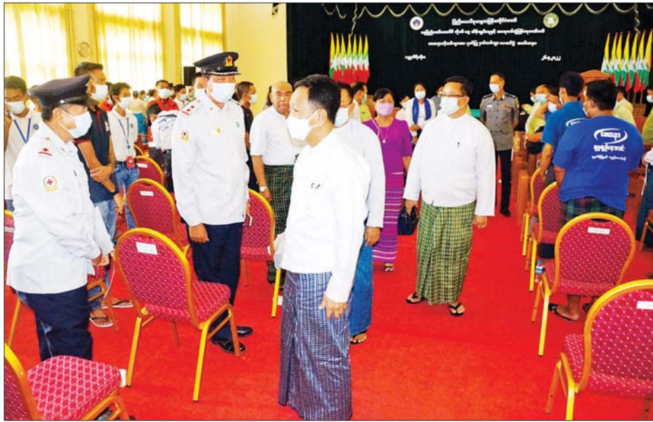
ကို အရှိန်အဟုန်မြှင့်ဆောင်ရွက်ခဲ့ကြသည့်အတွက် ကိုဗစ်-၁၉ ရောဂါ၏ အမျိုးမျိုးသော မျိုးကွဲသစ်များကို တားဆီးနိုင်ပြီဖြစ်ကြောင်း၊ ကိုဗစ်-၁၉ ရောဂါဖြစ်

နေပြည်တော်ကောင်စီဥက္ကဋ္ဌ ဒေါက်တာမောင်မောင်နိုင်ကပြည်သူ့လူထုအား ရောဂါကူးစက်ပြန့်ပွားမှုမရှိစေရန်နှင့် ကာကွယ်ရန်အတွက် ဌာနဆိုင်ရာများနှင့်အတူ ပူးပေါင်းကာ တက်တက်ကြွကြွ ဆောင်ရွက်ပေးခဲ့ကြသည့် စေတနာ့ဝန်ထမ်းများ၏ အခန်းကဏ္ဍကလည်း အဓိကကျကြောင်း၊ မိမိတို့အသက်အန္တရာယ်ကို ပဓာနမထားဘဲ ကြိုးကြိုးစားစားဆောင်ရွက်ခဲ့ကြသည့်အတွက် ယခုအခါ ကိုဗစ်-၁၉ ရောဂါ ကူးစက်မှုနှုန်း လျော့ပါးသွားပြီဖြစ်ကြောင်း၊ Quarantine Center များ၊ Positive Center များတွင် ကိုဗစ်-၁၉ ရောဂါ ကာကွယ်၊ ထိန်းချုပ်၊ တုံ့ပြန်ရေးလုပ်ငန်းများ