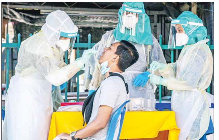
ရောဂါကာကွယ်ဆေး နှစ်ကြိမ် ထိုးနှံမှု ထိုးနှံမှုခံယူပြီးဖြစ်ကြောင်း သိရသည်။ ကိုးကား- ဆင်ဟွာ ဘာသာပြန်- အလင်းသစ်

ပြန်လည်ကျန်းမာလာသူ ၉၂၁၅ ဦး ရှိခြင်း ကြောင့် ရောဂါမှ ပြန်လည်ကျန်းမာလာ သူပေါင်း ၄၃၃၀၀၃၇ ဦး ရှိလာကြောင်းနှင့် လက်ရှိတွင် ကိုဗစ်-၁၉ ရောဂါပိုးတွေ့ရှိဆဲ လူနာစုစုပေါင်း ၆၈၀၀၇ ဦးရှိကြောင်း သိရသည်။ မလေးရှားနိုင်ငံ၌ နိုင်ငံလူဦးရေ၏ ၈၄ ဒသမ ၉ ရာခိုင်နှုန်းသည် ကိုဗစ်-၁၉ ရောဂါ ကာကွယ်ဆေး အနည်းဆုံး တစ်ကြိမ် ထိုးနှံမှုခံယူပြီးဖြစ်ကြောင်း၊ ၈၁ ဒသမ ၄ ရာခိုင်နှုန်းသည် ကိုဗစ်-၁၉