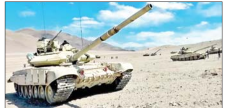
စာမျက်နှာ » ၁၂

ယနေ့ ဖတ်စရာ ၂၀၂၂ ခုနှစ်အတွင်း ကမ္ဘာလုံးဆိုင်ရာ စစ်ရေးအသုံးစရိတ် အမေရိကန်ဒေါ်လာ နှစ် ထရီလီယံအထိရှိခဲ့