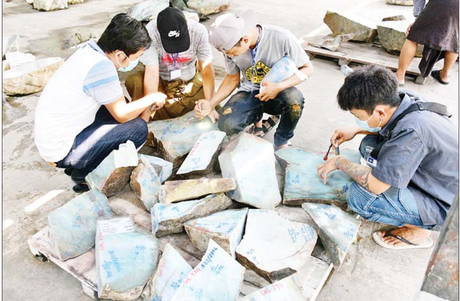
(၅၇)ကြိမ်မြောက် မြန်မာ့ကျောက်မျက်ရတနာပြပွဲတွင် ခင်းကျင်းပြသထားသည့် ကျောက်စိမ်းအတွဲ များကို ရတနာကုန်သည်များက လေ့လာကြည့်ရှုကြစဉ်။

ကျောက်မျက်ရတနာပြပွဲ ဗဟို ကော်မတီနာယက သယံဇာတနှင့် သဘာဝပတ်ဝန်းကျင် ထိန်းသိမ်း ရေးဝန်ကြီးဌာန ပြည်ထောင်စု ဝန်ကြီး ဦးခင်မောင်ရီနှင့် ပြပွဲ ဗဟိုကော်မတီဝင်များသည် မဏိရတနာ ကျောက်စိမ်းခန်းမ အတွင်းရှိ ကျောက်စိမ်းအတွဲများ အိတ်ဖွင့်တင်ဒါစနစ်ဖြင့် ရောင်းချ ပေးနေမှုကို ကြည့်ရှုအားပေး သည်။ နိုင်ငံတော်အတွက် နိုင်ငံခြား ဝင်ငွေရရှိရန်နှင့် နိုင်ငံသားများ အတွက် စီးပွားရေး အကျိုး ဖြစ်ထွန်းမှုများ ရရှိနိုင်စေရန် အတွက် တူးဖော်ထုတ်လုပ် ထားသည့် ကျောက်မျက်ရတနာ များကို ရောင်းချနိုင်မည့် မြန်မာ့ ကျောက်မျက်ရတနာပြပွဲများကို ၁၉၆၄ ခုနှစ်မှစတင်၍ အောင်မြင် စွာ ကျင်းပခဲ့ရာ ယခုကျင်းပ ပြုလုပ်သည့် (၅၇) ကြိမ်မြောက် မြန်မာ့ကျောက်မျက်ရတနာ ပြပွဲ တွင်လည်း ပြည်တွင်း ပြည်ပ ရတနာကုန်သည်များအနေဖြင့် ပုလဲအတွဲများနှင့် ကျောက်စိမ်း၊ ကျောက်မျက်အတွဲများကို စိတ်ပါ ဝင်စားစွာဖြင့် လေ့လာကြည့်ရှု ဝယ်ယူလျက်ရှိကြောင်း သိရ သည်။ သတင်းစဉ်